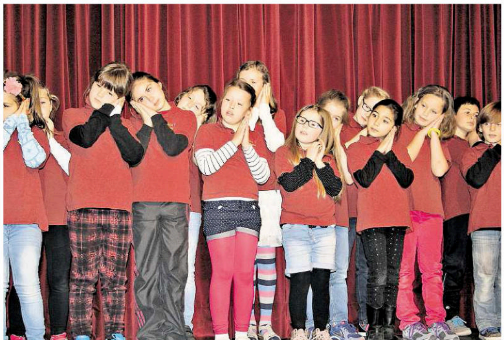
Der Chor der Ratsschule begeistert die Grundschüler mit seiner Darbietung.